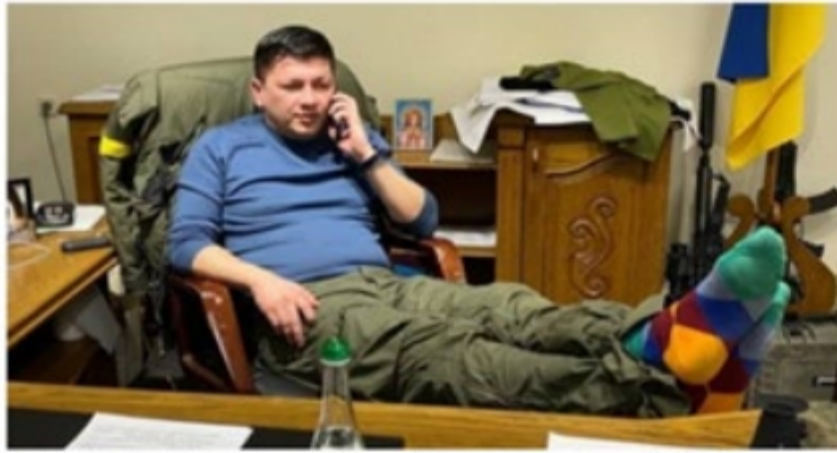
The Mykolaiv region's charismatic governor, Vitaliy Kim, is considered a likely successor to President Zelensky

The people of Mykolaiv are determined to block Putin's path to Odessa