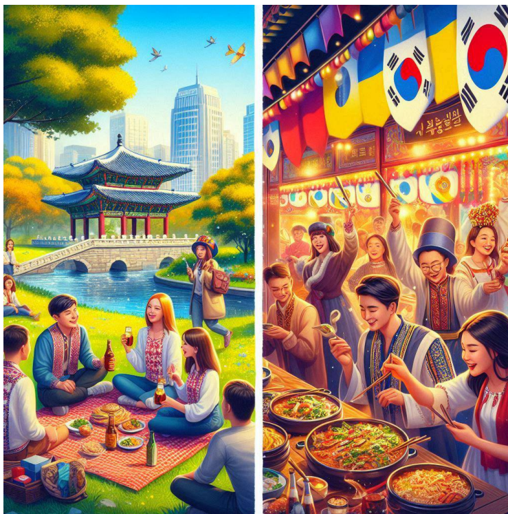
Фото згенероване ШІ