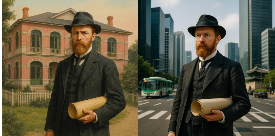
( Ілюстрації згенеровані AI )

Сеула. Порівняйте результат AI-візуалізації з власними уявленнями та історичними джерелами. Чи збіглося очікуване з отриманим? Які елементи візуального образу виявилися несподіваними або помилковими? Висвітліть це у своєму дослідженні.