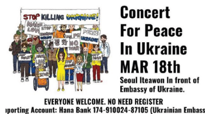
Афіша вуличного концерту за мир в Україні

● https://www.pressenza.com/2022/03/street-concert-for-peace-in-ukraine-and-a-friday-candlelight-vigil-in-seoul-south-korea/