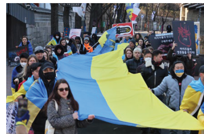
Українсько-корейський мітинг в Сеулі проти війни в Україні (2013) 55

Джерело: Посібник «Республіка Корея: Історія дива на річці Хан». Тема 6 с.336.